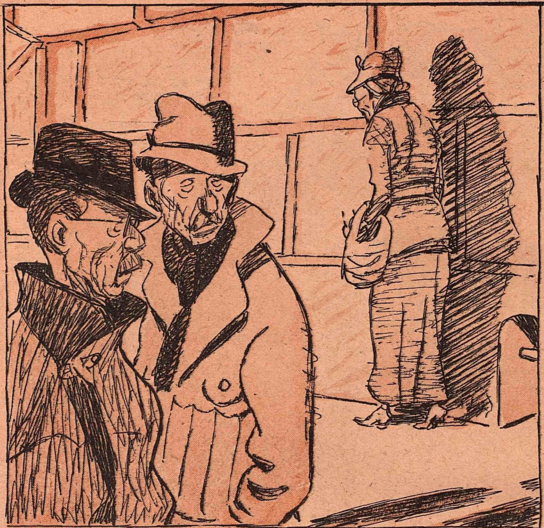
Рис. Ю. Ганфа

— Что случилось с фрау Хлюппе? — Говорят, у нее расстреляли мужа в тылу за не сдачу теплых вещей и сына — на фронте за сдачу русским города.