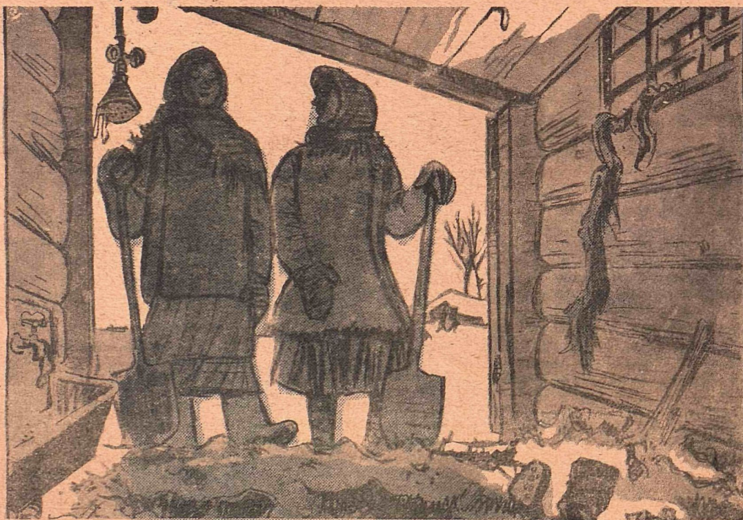
Рис. Б. Фридкина

— Надо хорошенько вычистить свинарник после немцев, а то ни одна свинья не станет в нем жить.