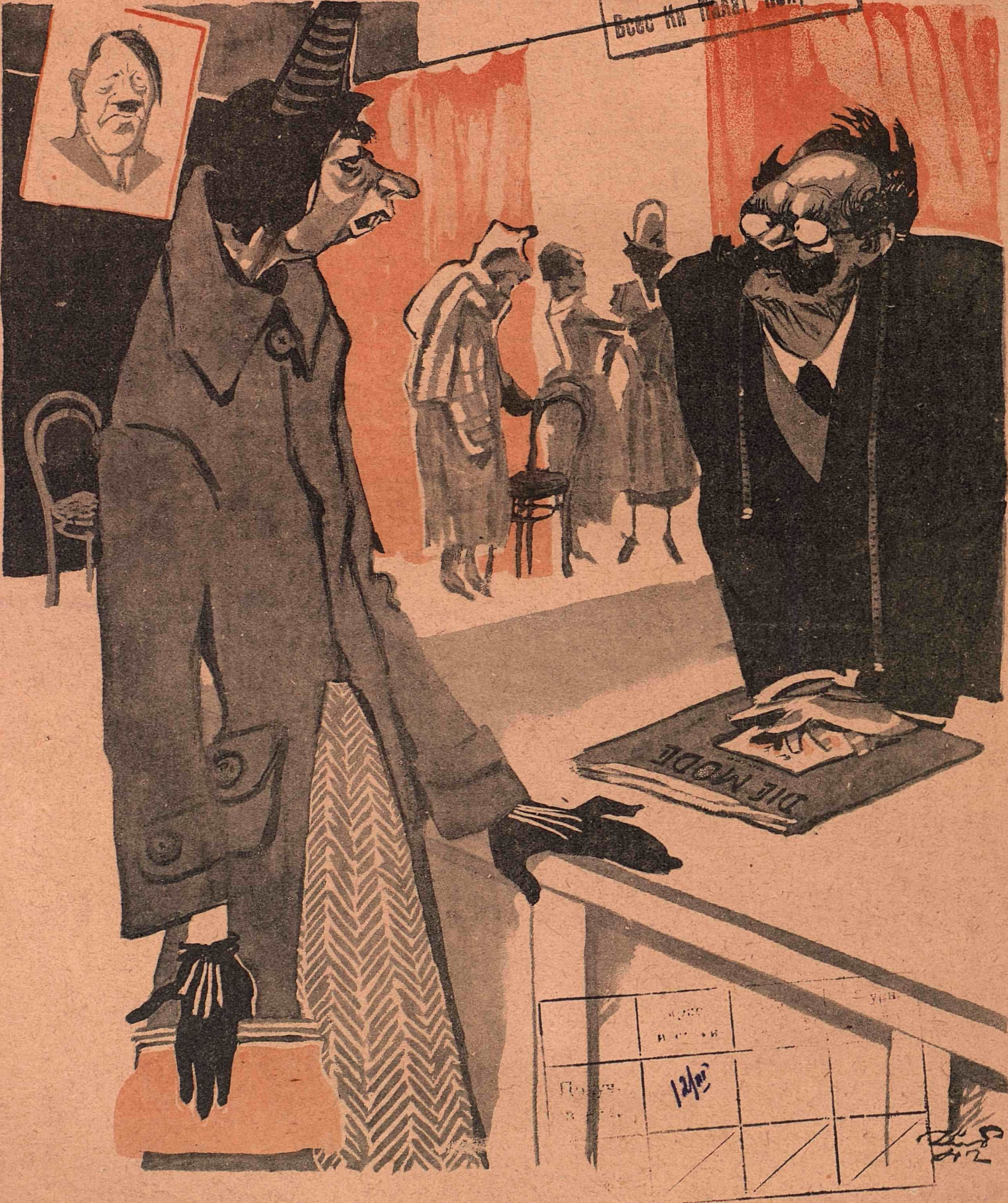
Рис. К. Елисеева

— Нет ли у вас чего-нибудь веселенького, пестрого... У меня убили мужа на фронте.