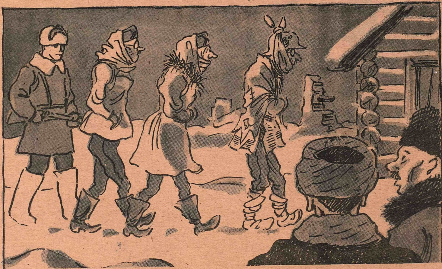
Рис. Н. Радлова

— Интересно, по какой моде они одеты? — По французской... 1812 года.